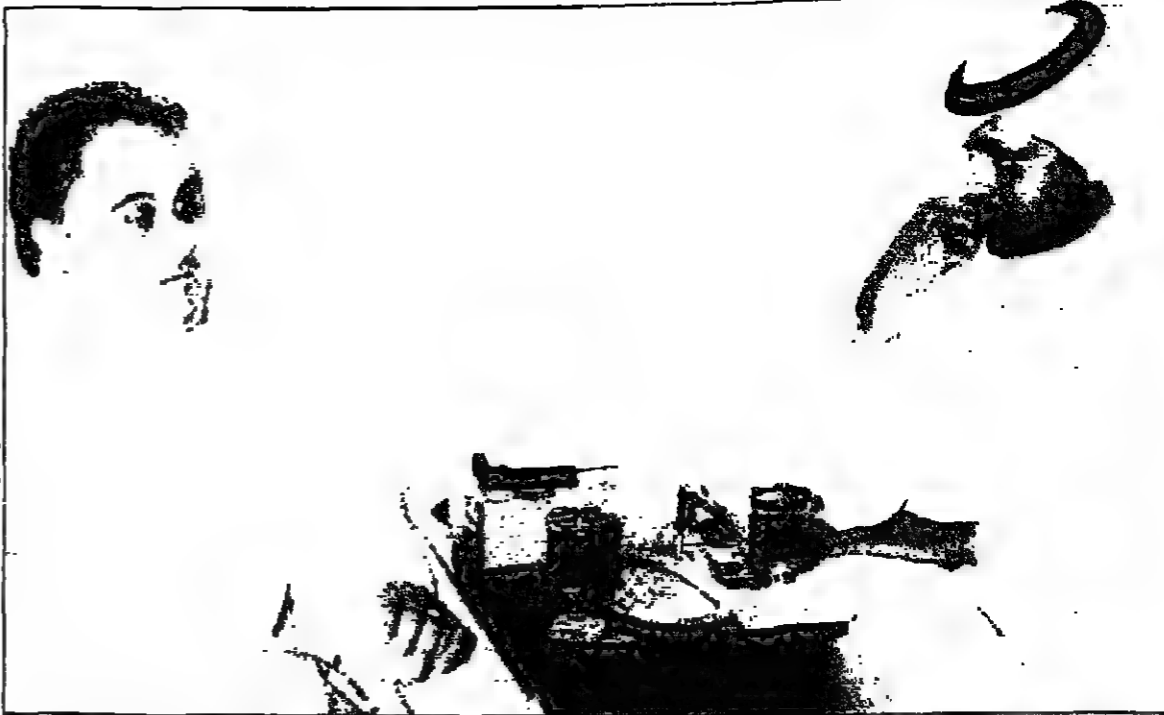
الدكتور صالح بن ناصر للمزيل امين حبيب يعجنيني القعد البناء اليبعد عن الاثارة